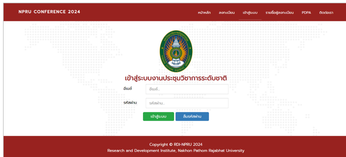
รูปที่ 2 หน้าเข้าสู่ระบบงานประชุมวิชาการระดับชาติ

2. จากนั้นป้อนอีเมล และรหัสผ่าน และคลิกปุ่ม “เข้าสู่ระบบ” เพื่อเข้าสู่ระบบงานประชุมวิชาการระดับชาติ ดังรูปที่ 2