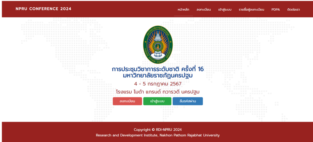
รูปที่ 1 หน้าแรก rdi.npru.ac.th/conference16/

1. เปิดเว็บเบราว์เซอร์ Google Chrome แล้วพิมพ์ URL : rdi.npru.ac.th/conference16/ และคลิกที่เมนู “เข้าสู่ระบบ” ดังรูปที่ 1