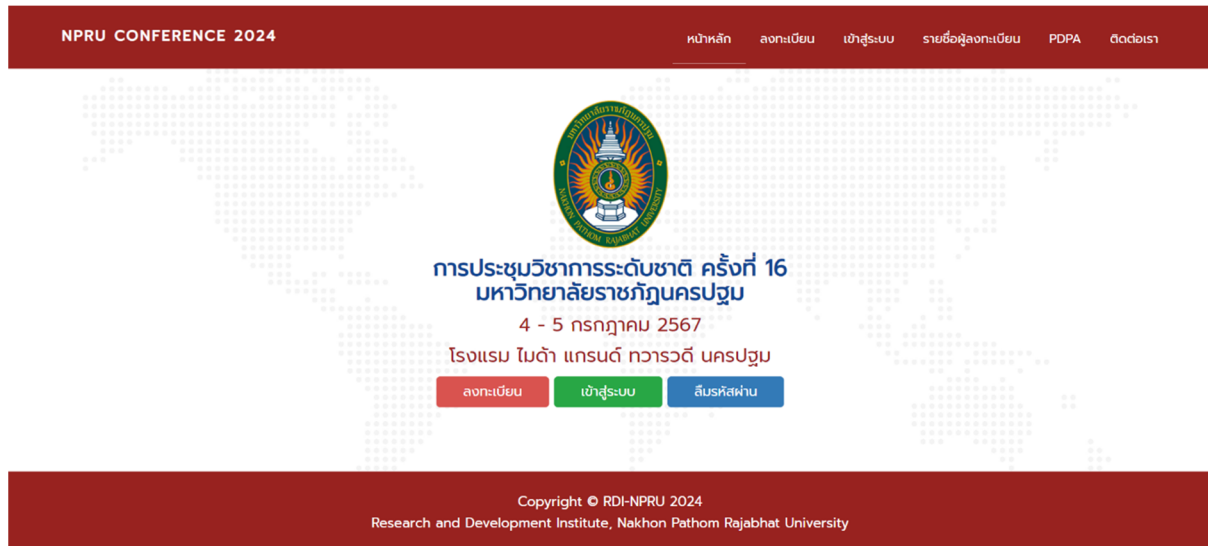
รูปที่ 1 หน้าแรก rdi.npru.ac.th/conference16/