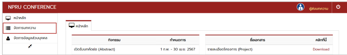
รูปที่ 3 หน้าหลัก และคลิกเมนูจัดการบทความ

3. เมื่อเข้าสู่หน้าหลักให้คลิกที่เมนู “จัดการบทความ” ดังรูปที่ 3