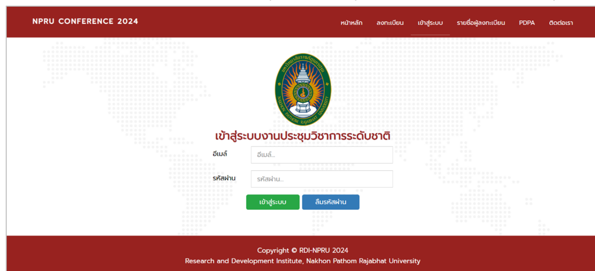
รูปที่ 2 หน้าเข้าสู่ระบบงานประชุมวิชาการระดับชาติ

ทั้งนี้หากมีข้อสงสัยใดๆ สามารถติดต่อได้ที่ 0-3410-9300 ต่อ 3910 หรือที่ Email: conference16@npru.ac.th