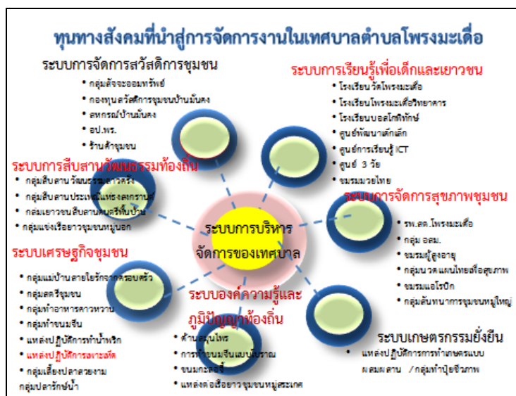
รูปภาพที่ 1 ทุนทางทรัพยากรชีวภาพ สังคม วัฒนธรรมและภูมิปัญญา

จากการศึกษาพบว่า การนำใช้ทุนทางวัฒนธรรมและภูมิปัญญาท้องถิ่น ของเทศบาลตำบลโพรงมะเดื่อ เน้นการนำภูมิปัญญาท้องถิ่นมาใช้เป็นทุนในการพัฒนาชุมชนในเขตเทศบาล ในด้านการยกระดับคุณภาพชีวิต โดยเทศบาลตำบลโพรงมะเดื่อมีการจัดการระดมความคิด ความต้องการของชุมชนท้องถิ่น เพื่อเป็นการลดความขัดแย้งระหว่างชุมชนกับภาครัฐ ภูมิปัญญาท้องถิ่นบางสาขาเป็นองค์ความรู้ที่นำมาใช้แก้ปัญหาสังคมได้ เช่น องค์ความรู้ด้านดนตรีพื้นบ้าน ปราชญ์ด้านดนตรีได้ช่วยถ่ายทอดให้เด็กและเยาวชนได้ฝึกหัดและแสดงออกทุกวันโดยไม่ไปมีว่สมแหล่งอบายมุขอื่น ๆ ภูมิปัญญาด้านความเชื่อ ช่วยให้คนในสังคมในชุมชนได้มาร่วมชุมชนนุสร้างการมีส่วนร่วม เช่น งานประเพณีแห่ธงสงกรานต์แบบลาวครั้ง งานทำบุญกลางบ้าน ภูมิปัญญาด้านอาหาร ภูมิปัญญาด้านสมุนไพร เป็นต้น โดยมีรายละเอียดการบูรณาการการนำใช้ทุนทางวัฒนธรรมและภูมิปัญญาท้องถิ่นสู่การพัฒนาชุมชนในด้านต่าง ๆ ในเขตเทศบาลตำบลโพรงมะเดื่อ ได้แก่ 1) กลุ่มสืบสาน