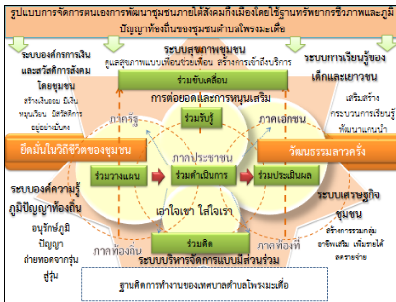
รูปภาพที่ 3 ความเชื่อมโยงของการนำใช้ทุนทรัพยากรชีวภาพ ทุนทางวัฒนธรรม ภูมิปัญญาท้องถิ่นสู่ระบบการจัดการตนเอง

วัฒนธรรมลาวครั่ง 2) เกษตรกรต้นแบบเศรษฐกิจพอเพียง 3) โรงเรียนพุทธศาสนาวันอาทิตย์ (วัดโพธิ์ระเมเคือ) 4) ภูมิปัญญา การต่อเรือยาวชุมชนหมู่สระเกศ 5) ภูมิปัญญาการทำขนมจีน 6) กลุ่มเยาวชนสืบสานดนตรีพื้นบ้าน 7) กลุ่มเลี้ยงปลาสวายงาม ชุมชนกาเลี้ยงลูก 8) กลุ่มเพาะเห็ด หมู่ 13