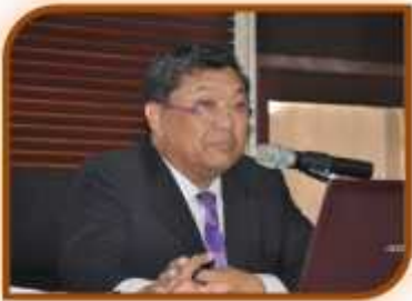
รองศาสตราจารย์ ดร.เสนห์ เอกะวิภาต