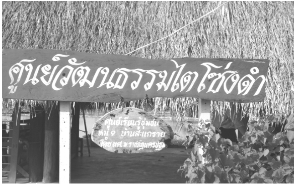
ภาพที่ 3 ป้ายศูนย์วัฒนธรรมไตโซ่งดำ (ศูนย์วัฒนธรรมไตโซ่งดำ , 2552)

4. ปัจจัยที่ส่งเสริมการท่องเที่ยว จากการศึกษาพบว่า หมู่บ้านสะแกราย มีปัจจัยหลายด้านที่เกี่ยวข้องกับการส่งเสริมให้นักท่องเที่ยวเกิดความสะดวกในการเข้าสู่พื้นที่ ดังนี้