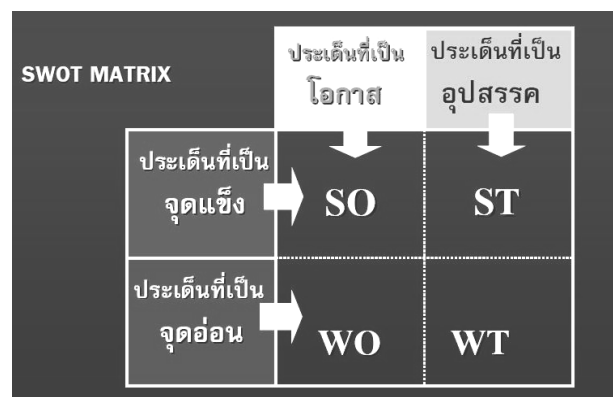
ภาพที่ 1 การกำหนดกลยุทธ์โดยใช้เครื่องมือ TOWS MATRIX

จากการวิเคราะห์สภาพแวดล้อมภายในและสภาพแวดล้อมภายนอกขององค์กรสามารถที่จะนำคะแนนถ่วงน้ำหนักในการวิเคราะห์แต่ละด้านมากำหนดเป็น Matrix ปัจจัยภายในและภายนอกขององค์กร เพื่อกำหนดกลยุทธ์ขององค์กร และองค์กรบางแห่งได้มีการทำผลวิเคราะห์ SWOT ไปจัดทำกลยุทธ์ โดยนำปัจจัยแต่ละประการมาจับคู่กันและกำหนดเป็นกลยุทธ์ต่างๆ เรียกว่า TOWS Matrix ดังแสดงในภาพ