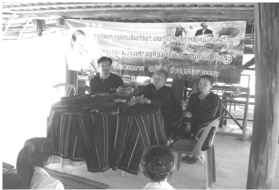
ภาพที่ 4 การบรรยายวิถีชีวิตให้แก่นักศึกษาที่เข้ามาดูงาน (หมู่บ้านสะแกราย, 2552)

4.2 การให้บริการแก่นักท่องเที่ยว ได้แก่ การสาธิตวิถีชีวิตและภูมิปัญญาพื้นบ้าน และการจัดตลาดน้ำสาธิต