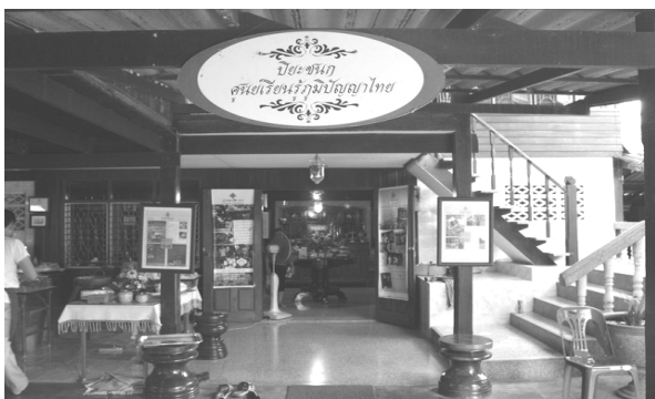
ภาพที่ 2 ศูนย์เรียนรู้ภูมิปัญญาไทย ปิยะชนก (ศูนย์ปิยะชนก, 2552)

3.2 แหล่งท่องเที่ยวบริเวณโดยรอบและในพื้นที่ ได้แก่ ศูนย์เรียนรู้ภูมิปัญญาไทย ปิยะชนก ซึ่งถือเป็นแหล่งเรียนรู้ด้านการพัฒนาชุมชนในระดับฐานราก และสร้างความเข้มแข็งชุมชนด้วยการพัฒนาภูมิปัญญาท้องถิ่น โดยมีกิจกรรมต่างๆ เช่น การเยี่ยมชมภายในศูนย์เรียนรู้ภูมิปัญญาไทย “ปิยะชนก” การรับฟังการบรรยายสรุปประวัติของหมู่บ้าน และปรัชญา การดำรงชีวิตชาวไทดำ รวมถึงแวะรับประทานอาหารพื้นบ้านและซื้อของที่ระลึก เป็นต้น ซึ่งอาจกล่าวได้ว่า ศูนย์เรียนรู้ภูมิปัญญาไทย ปิยะชนก เป็นเสมือนแหล่งเรียนรู้ของคนในชุมชนในด้านต่างๆ เช่น การร่วมประชุมเพื่อพบปะหารือกันระหว่างคนในชุมชน การฝึกขายสินค้าที่มีอยู่ในชุมชน การถ่ายทอดความรู้ภูมิปัญญาท้องถิ่นของปราชญ์ชาวบ้านผู้ถูกหลานของคนในชุมชน รวมถึงการฝึกวิธีการบริหารจัดการของผู้นำชุมชนเพื่อรองรับการที่หมู่บ้านจะเป็นแหล่งท่องเที่ยวในอนาคตอีกด้วย