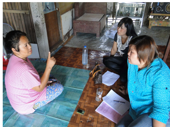
ภาพที่ 1 ลงพื้นที่สัมภาษณ์

ลักษณะการมีส่วนร่วมของประชาชนในชุมชนลำพญา อำเภอบางเลน จังหวัดนครปฐมนั้น จะเป็นการมีส่วนร่วมทางอ้อม (Indirect Participation) ส่วนร่วมแบบแข็งขัน การมีส่วนร่วมแบบไม่แข็งขัน และการมีส่วนร่วมแบบเฉื่อยชา ซึ่งเป็นไปตามที่ได้กล่าวไว้เบื้องต้น ว่าลักษณะของการมีส่วนร่วมทั้งสามแบบนี้ จะแปรผันไปตามบทบาทของประชาชนแต่ละคนและความสนใจในการมีส่วนร่วม แต่สำหรับประชาชนส่วนใหญ่อาจแบ่งออกได้เป็นทั้งสองกลุ่มคือ แบบไม่แข็งขันและแบบเฉื่อยชา นอกจากนั้นลักษณะของการมีส่วนร่วมของประชาชนภายในชุมชนตำบลลำพญา อำเภอบางเลน จังหวัดนครปฐม ยังมีลักษณะผสมผสานกันระหว่างการมีส่วนร่วมแบบเป็นไปเองและการมีส่วนร่วมแบบชักนำ ทั้งนี้การศึกษาถึงลักษณะการมีส่วนร่วมในเบื้องต้นนั้นถึงจะพบว่าประชาชนเข้ามามีส่วนร่วมในหลาย ๆ ลักษณะแต่อัตราส่วนของการมีส่วนร่วมนั้นมีเพียง 60% เท่านั้น ซึ่งจัดว่าอยู่ในเกณฑ์ปานกลาง