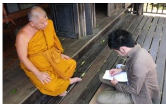
รูป 2.1 แสดงตัวอย่างการลงพื้นที่การสัมภาษณ์และศึกษาดูงานศูนย์การเรียนรู้และพิพิธภัณฑสถานพื้นบ้าน

โดยวิธีการดำเนินการ ผู้วิจัยและนักศึกษาติดต่อประสานงานกับสภาวัฒนธรรม นายกองค้การบริหารส่วนตำบลลำพญา และผู้นำชุมชน รวมทั้งผู้บริหารจัดการศูนย์การเรียนรู้แหล่งอื่นๆที่ประสบความสำเร็จเพื่อขอลงพื้นที่ ผู้วิจัยและนักศึกษาศึกษาค้นคว้าข้อมูลเอกสารและงานวิจัยที่เกี่ยวข้องเกี่ยวกับศูนย์การเรียนรู้และพิพิธภัณฑสถานพื้นบ้านตลาดน้ำวัดลำพญา รวมทั้งศึกษาดูงานศูนย์การเรียนรู้ที่ประสบความสำเร็จ ผู้วิจัยและนักศึกษาประสานงานและดำเนินการร่วมกับเจ้าหน้าที่เกี่ยวข้องด้านบริหารจัดการพิพิธภัณฑสถานและศูนย์การเรียนรู้ ทั้งด้านพิพิธภัณฑสถานพื้นบ้านวัดลำพญา และผู้บริหารจัดการศูนย์การเรียนรู้แหล่งอื่นๆ โดยใช้บทสัมภาษณ์และวิเคราะห์บทสัมภาษณ์และนำมาสังเคราะห์เป็นด้านๆ เพื่อใช้สร้างแบบสอบถามและนำแบบสอบถามไปสำรวจกับกลุ่มเป้าหมายที่กำหนดไว้ วิเคราะห์ข้อมูลจากแบบสอบถาม และนำผลการวิเคราะห์ข้อมูลจากแบบสอบถามรวมทั้งผลที่ได้จากการวิเคราะห์ และประชุมผู้ที่มีส่วนเกี่ยวข้องกัับพิพิธภัณฑสถานพื้นบ้านวัดลำพญา เพื่อหาแนวทางในการพัฒนาศูนย์การเรียนรู้พิพิธภัณฑสถานพื้นบ้านตลาดน้ำวัดลำพญา