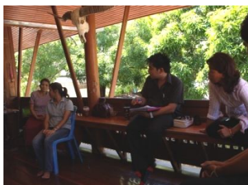
รูปที่ 2.2 แสดงตัวอย่างการประชุมเพื่อหาแนวทางการพัฒนาศูนย์การเรียนรู้พิพิธภัณฑสถานพื้นบ้านวัดลำพญา