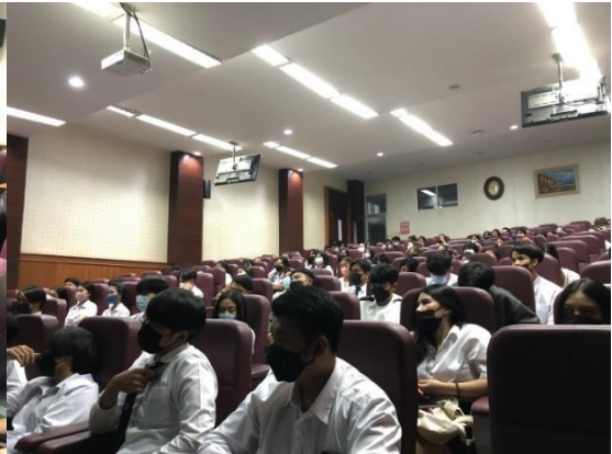
ภาพกิจกรรม โครงการภาษาอังกฤษสำหรับการจัดการโลจิสติกส์และโซ่อุปทาน