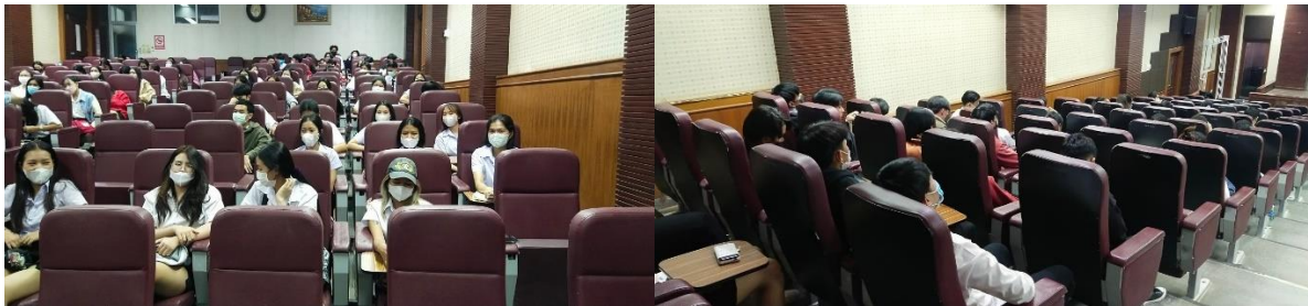
ภาพกิจกรรม โครงการอบรมการบูรณาการเรียนรู้กับการทำงาน (WIL)