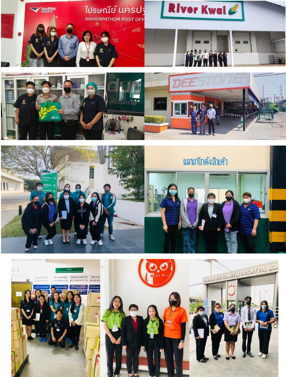
ภาพกิจกรรม สหกิจศึกษา

ชั้นปีที่ 4 มุ่งเน้นการพัฒนาสมรรถนะด้านพื้นฐานวิชาชีพ การประยุกต์ใช้ทักษะและกลยุทธ์ด้าน โลจิสติกส์และโซ่อุปทาน สหกิจศึกษา สัมมนาเชิงวิชาการโครงการสหกิจศึกษา และการสอบประมวลความรู้ ก่อนสำเร็จการศึกษา