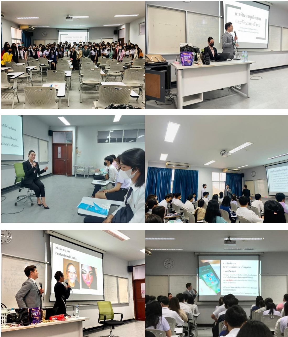
ภาพกิจกรรมโครงการอบรมการพัฒนาบุคลิกภาพและทักษะการเข้าสังคม

ชั้นปีที่ 1 มุ่งเน้นการปรับตัวเข้ากับการเรียนระดับปริญญาตรี การพัฒนาบุคลิกภาพและทักษะ การ เข้าสังคม มนุษยสัมพันธ์และการสื่อสาร พื้นฐานเทคโนโลยีสารสนเทศและการสื่อสาร