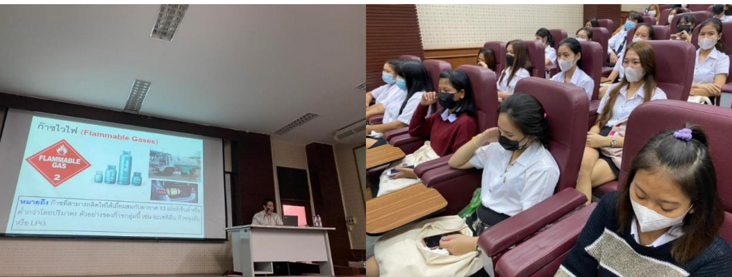
ภาพกิจกรรม โครงการอบรมเชิงปฏิบัติการด้านสินค้าอันตรายและความปลอดภัยในอุตสาหกรรม

ชั้นปีที่ 3 มุ่งเน้นการพัฒนาสมรรถนะด้านทักษะการประยุกต์ใช้ดิจิทัลในการจัดการโลจิสติกส์และโซ่อุปทาน การบูรณาการการเรียนรู้กับการทำงาน และการศึกษาคุณงานนอกระบบที่ เพื่อมุ่งสู่การเป็นบัณฑิตนักปฏิบัติ