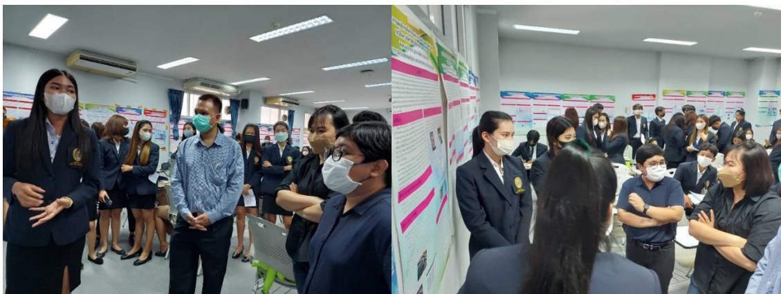
ภาพกิจกรรม โครงการสัมมนาเชิงวิชาการโครงการงานสหกิจศึกษาสาขาการจัดการโลจิสติกส์และโซ่อุปทาน