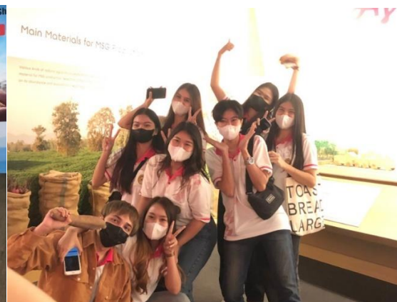
ภาพกิจกรรม โครงการศึกษาดูงานนอกสถานที่ สาขาการจัดการโลจิสติกส์และโซ่อุปทาน