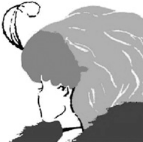
ภาพที่ 1 ภาพลวงตา

ผู้เขียนได้นำเสนอรายละเอียดที่เกี่ยวข้องกับการรับรู้ไว้อย่างครบถ้วน อาทิ ความหมาย การตีความจากประสาทสัมผัส การจัดกลุ่มการรับรู้ ปัจจัยที่มีอิทธิพลต่อการรับรู้ อุปสรรคการรับรู้ เป็นต้น จุดเด่นของบทนี้คือนำเสนอภาพลวงตาให้ผู้อ่านได้ทดสอบประสาทสัมผัสการรับรู้