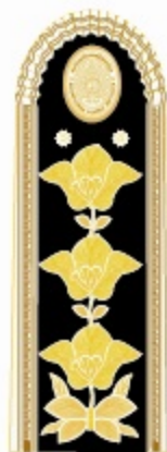
ค่านหน้า