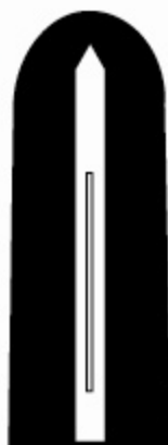
ค่านหลัง