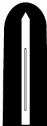
ค่านหลัง