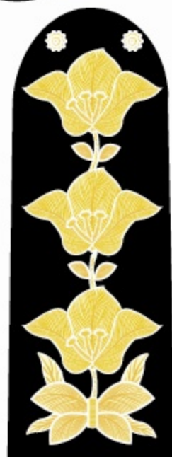
รูปลายตาช