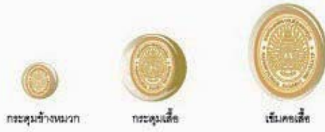
กะตุมช้างหมวก