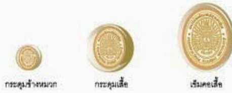
กะตุมช้างหมวก