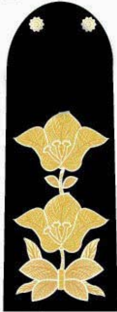
รูปขยายลาย