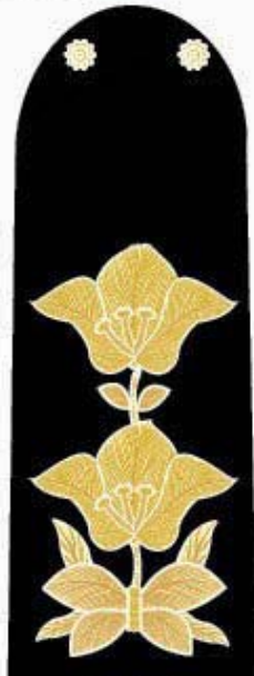
รูปขยายลาย