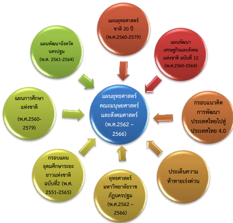
ภาพที่ 1 กรอบแนวคิดในการจัดทำแผนยุทธศาสตร์คณะมนุษยศาสตร์และสังคมศาสตร์ พ.ศ.2562 – 2566

การกำหนดกรอบแนวคิดในการพัฒนาคณะมนุษยศาสตร์และสังคมศาสตร์ใช้วิธีการศึกษาบริบทที่สำคัญของประเทศไทยในยุคปัจจุบันโดยการศึกษาจากแผนยุทธศาสตร์ชาติ 20 ปี (พ.ศ.2560-2579) แผนพัฒนาเศรษฐกิจและสังคมแห่งชาติ ฉบับที่ 12 (พ.ศ.2560-2564) กรอบแนวคิดในการพัฒนาประเทศไทยเพื่อไปสู่ประเทศไทย 4.0 แผนพัฒนาจังหวัดนครปฐม (พ.ศ. 2561 - 2564) แผนการศึกษาแห่งชาติ (พ.ศ.2560 - 2579) กรอบแผนอุดมศึกษาระยะยาวแห่งชาติ ฉบับที่ 2 (พ.ศ. 2551 - 2565) รวมทั้งยุทธศาสตร์มหาวิทยาลัยราชภัฏนครปฐม (พ.ศ.2562 – 2566) การวิเคราะห์สภาพแวดล้อมคณะมนุษยศาสตร์และสังคมศาสตร์ และพิจารณาจากประเด็นความท้าทายเร่งด่วนที่คาดว่าจะส่งผลกระทบต่อการพัฒนาคณะมนุษยศาสตร์และสังคมศาสตร์ในอนาคต อาทิ โครงสร้างประชากรไทยที่เข้าสู่สังคมผู้สูงอายุ (Aging Society) ความจำเป็นของการพัฒนาแรงงาน โครงการลงทุนขนาดใหญ่ของรัฐบาล (Mega Projects) เส้นทางคมนาคมระหว่างประเทศ (Logistics) เขตเศรษฐกิจพิเศษ เศรษฐกิจดิจิทัล (Digital Economy) ทักษะของบัณฑิตในศตวรรษที่ 21 กรอบแนวคิดดังกล่าวแสดงในภาพที่ 1 และตารางที่ 1 ดังนี้