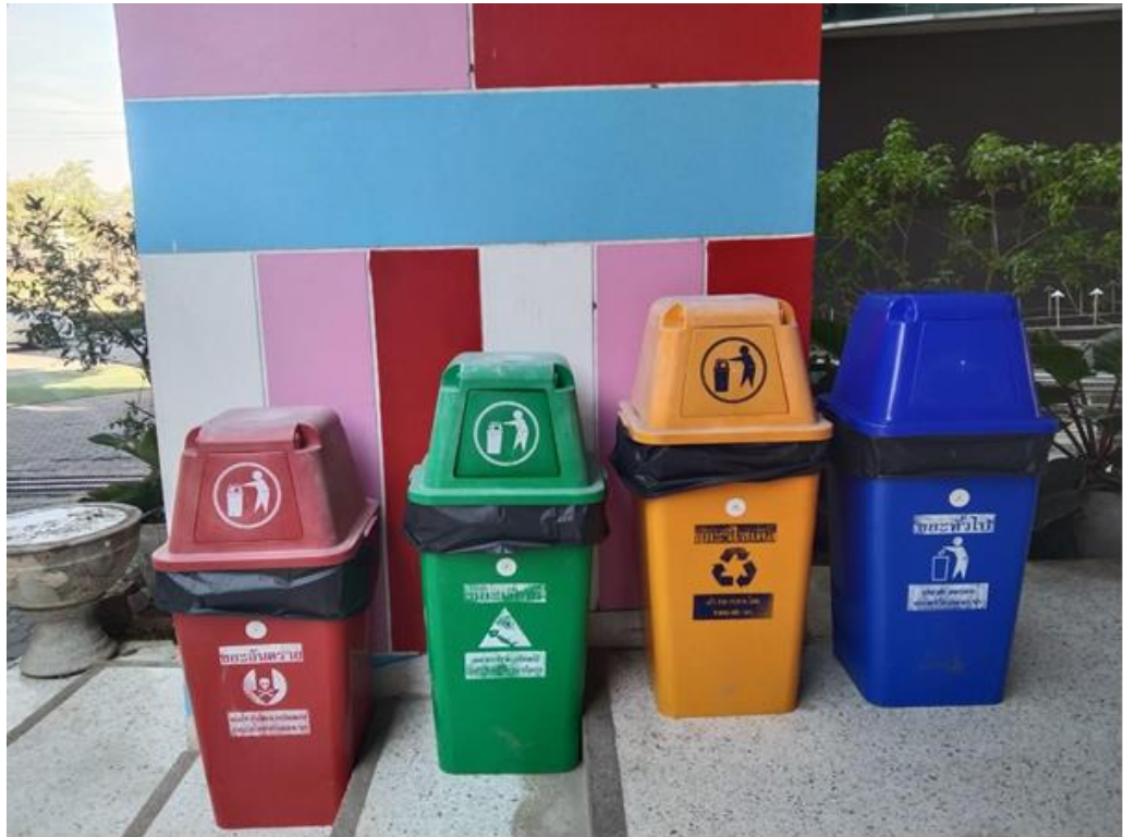
ภาพถังขยะ 4 สี ภายนอกอาคาร