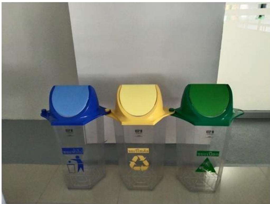
ภาพถังขยะ 4 สี ภายในอาคาร