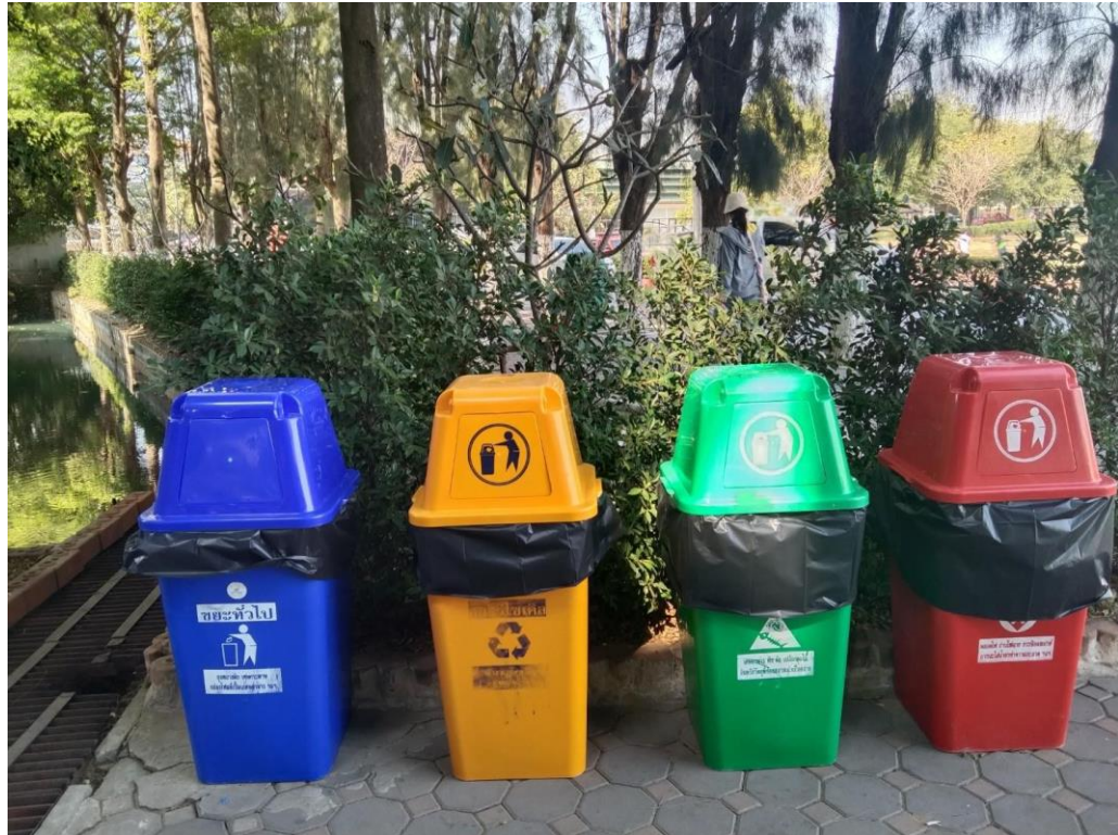
ภาพถังขยะ 4 สี บริเวณทิวสน