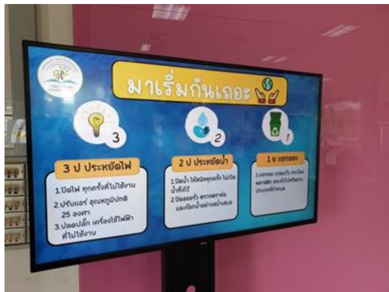
การเผยแพร่ประชาสัมพันธ์เพื่อรณรงค์การใช้น้ำ ใช้ไฟอย่างประหยัดผ่านจอทีวีไซเนจ