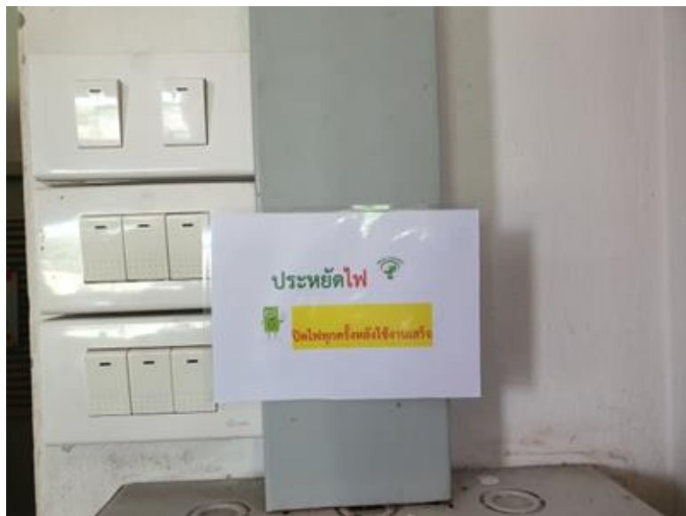
ติดป้ายเพื่อรณรงค์การใช้ไฟอย่างประหยัดตามบริเวณที่มีสวิตช์เปิด-ปิดไฟ