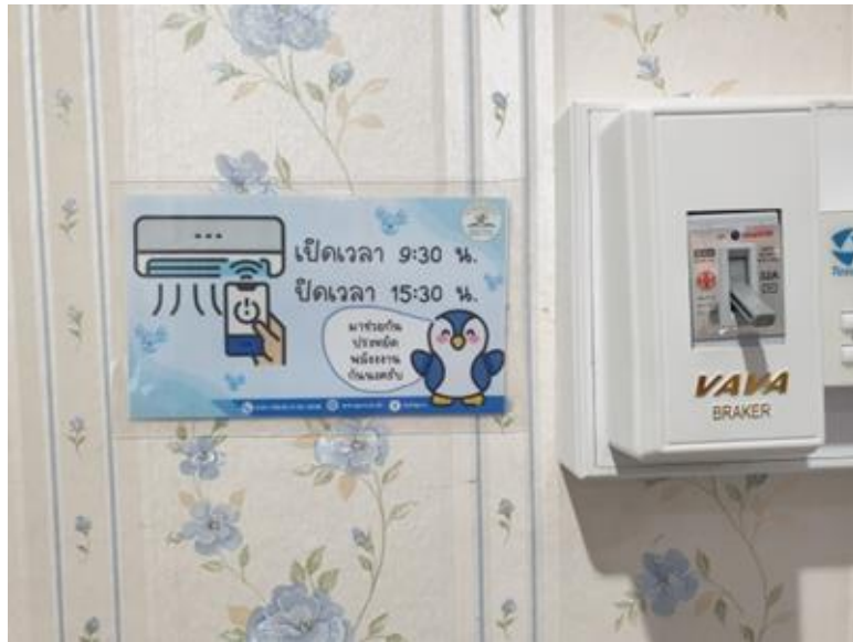
ติดป้ายกำหนดเวลาเปิด-ปิดเครื่องปรับอากาศเพื่อการประหยัดไฟ