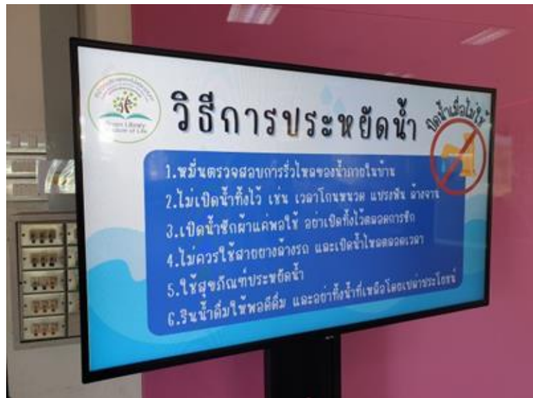
การเผยแพร่ประชาสัมพันธ์เพื่อรณรงค์การใช้น้ำ ใช้ไฟอย่างประหยัดผ่านจอทีวีไซเนจ