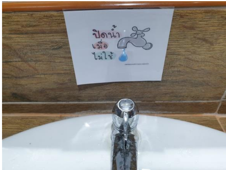
ติดป้ายเพื่อรณรงค์การใช้น้ำอย่างประหยัดในห้องน้ำ