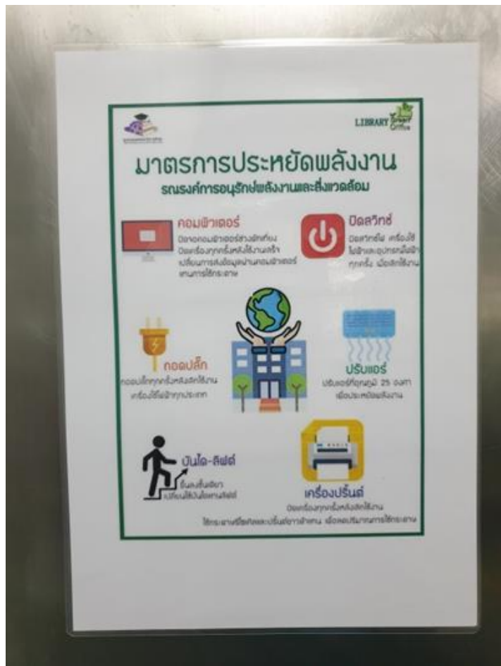
ติดป้ายมาตรการประหยัดพลังงานในลิฟท์โดยสาร