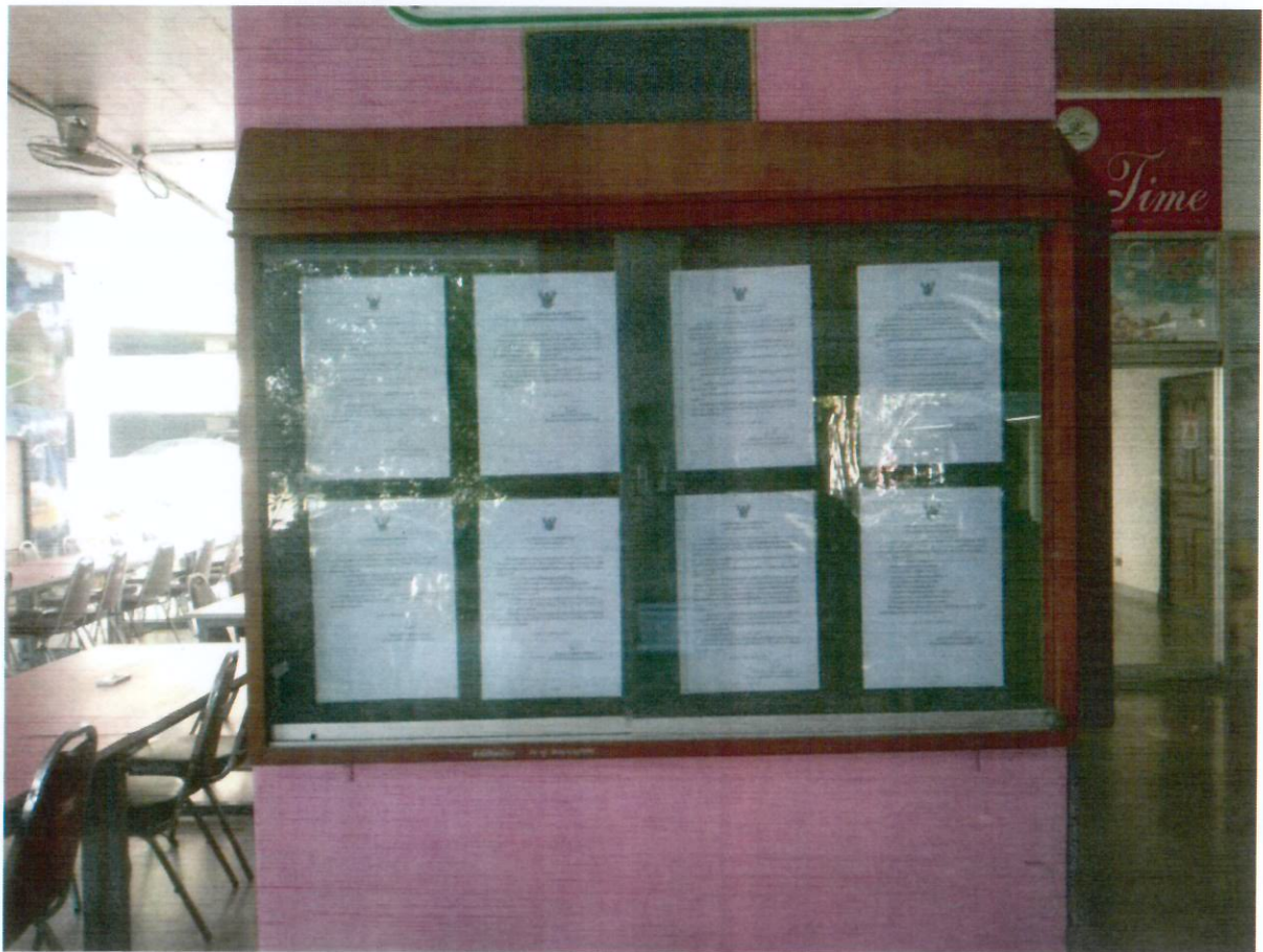
ภาพ ป้ายประชาสัมพันธ์ภายในอาคาร