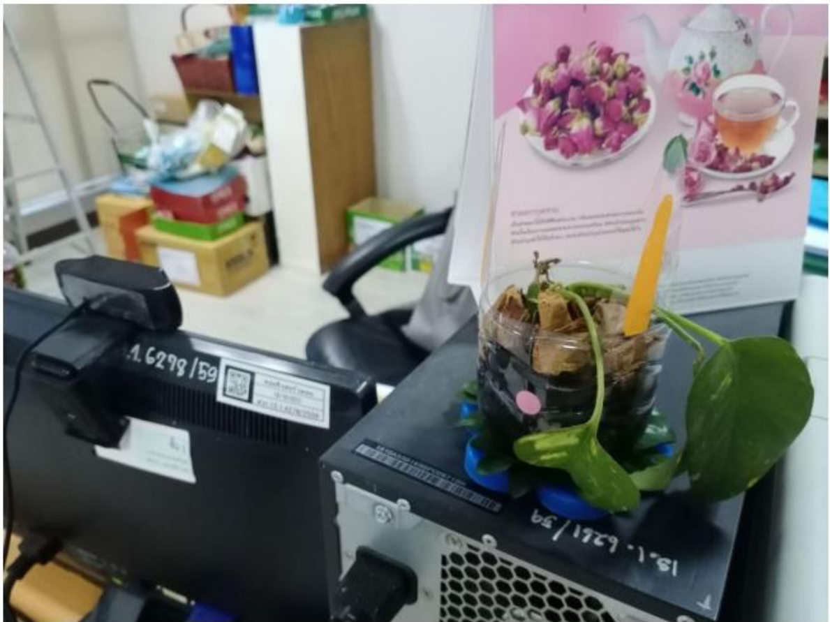
การนำขวดน้ำพลาสติกมาประดิษฐ์เป็นแจกันดอกไม้ กระจ่างต้นไม้