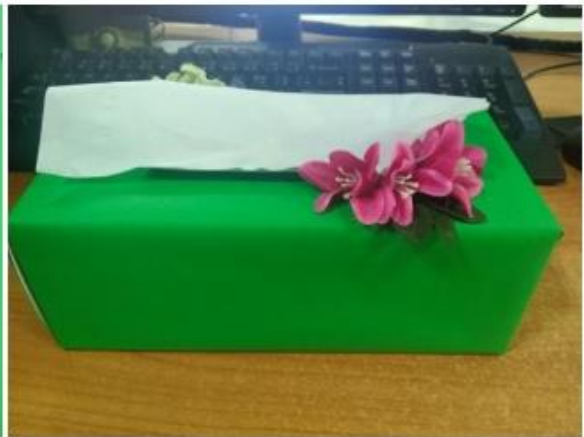
กล่องใส่กระดาษทิชชู