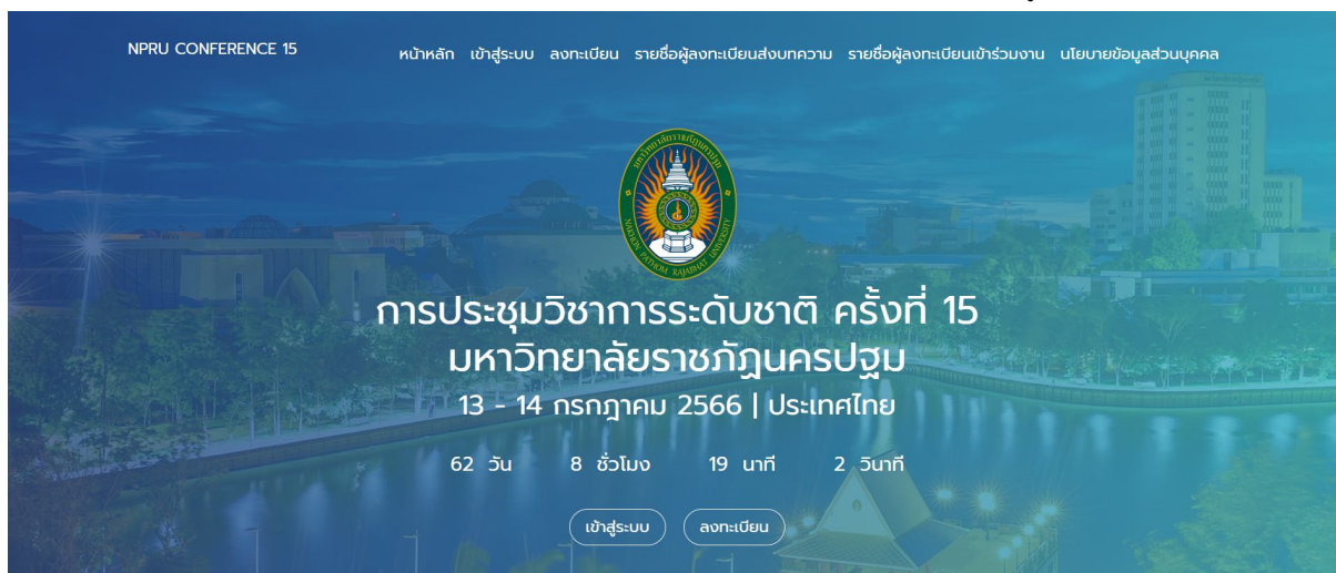
รูปที่ 1 ระบบงานประชุมวิชาการระดับชาติ ครั้งที่ 15

1. เปิดเว็บเบราว์เซอร์ Google Chrome แล้วพิมพ์ URL : rdi.npru.ac.th/conference15/ ดังรูปที่ 1