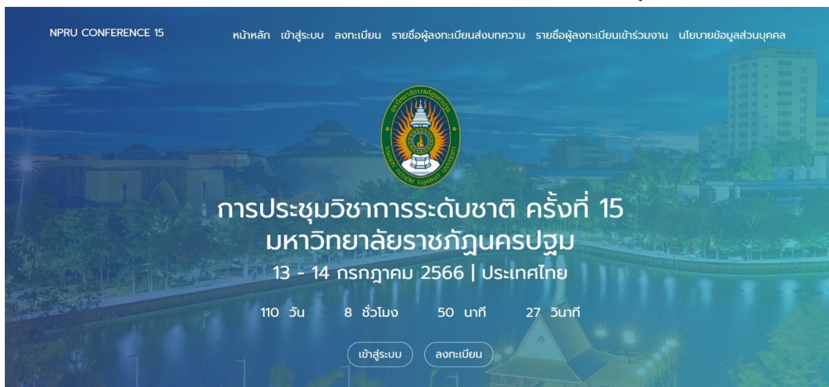
รูปที่ 1 ระบบงานประชุมวิชาการระดับชาติ ครั้งที่ 15

1. เปิดเว็บเบราว์เซอร์ Google Chrome แล้วพิมพ์ URL : rdi.npru.ac.th/conference15/ ดังรูปที่ 1