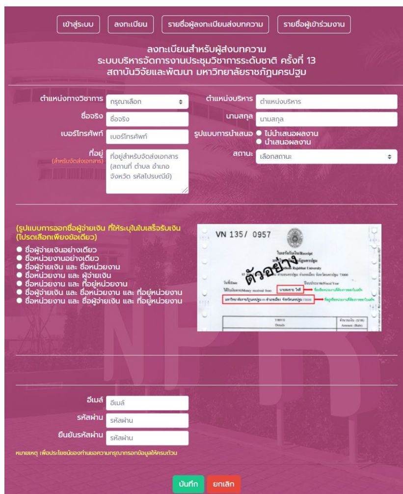
รูปที่ 2 ตัวอย่างหน้าลงทะเบียน (กรณีไม่มีบัญชีผู้ใช้)