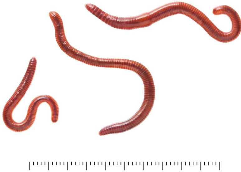
ภาพที่ 6 ลักษณะของ Eisenia foetida