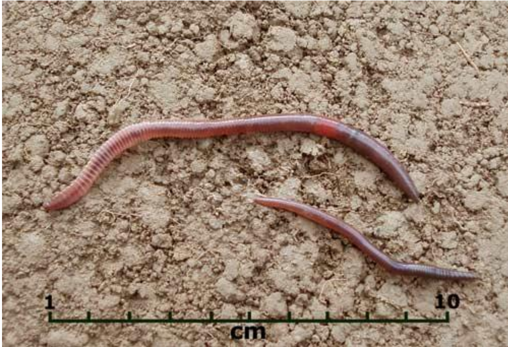
ภาพที่ 8 ลักษณะของ Lumbricus rubellus

ไส้เดือนดินสายพันธุ์ ลัมบริคัส รูเบลคัส รูเบลลัส เป็นไส้เดือนดินสีแดงที่มีลำตัวแบนและมีลำตัวขนาดกลางไม่ใหญ่มาก โดยจะมีลำตัวใหญ่กว่าไส้เดือนดินสายพันธุ์อายุซิเนีย พูทิดา และเล็กกว่าไส้เดือนดินสายพันธุ์อัฟริกันไนท์ครอเลอร์