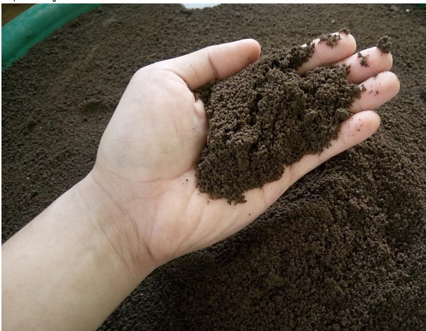
ภาพที่ 1 ปุ๋ยมักมูลไส้เดือน

ปุ๋ยมักมูลไส้เดือนดิน (Vermicompost) หมายถึง เศษซากอินทรีย์วัตถุต่างๆ รวมทั้งดินและจุลินทรีย์ที่ไส้เดือนดินกินเข้าไปแล้วผ่านกระบวนการย่อยสลายอินทรีย์วัตถุนั้นภายในลำไส้ของไส้เดือนดิน แล้วจึงขับถ่ายเป็น นมุลออกมาทางรูทวาร ซึ่งมูลที่ได้จะมีลักษณะเป็นเม็ดสีดำ มีธาตุอาหารที่ขอยู่ในรูปที่พืชสามารถนำไปใช้ได้ปริมาณที่สูงและมีจุลินทรีย์จำนวนมาก ซึ่งในกระบวนการผลิตปุ๋ยมักโดยใช้ไส้เดือนดินขยะอินทรีย์ที่ไส้เดือนดินกินเข้าไป และผ่านการย่อยสลายในลำไส้แล้วขับถ่ายออกมา มูลไส้เดือนดินที่ได้เรียกว่า “ปุ๋ยมักมูลไส้เดือนดิน”