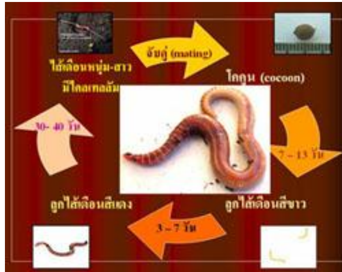
ภาพที่ 4 วงจรชีวิตไส้เดือน

การกินอาหาร (consumption) ไส้เดือนดินกินใบไม้ร่วงในปริมาตรสูง และปริมาณที่กินขึ้นกับคุณภาพของสารอินทรีย์ที่สามารถใช้ได้มากจะกลายเป็นปัจจัยอื่น ๆ ถ้าดินมีลักษณะทางกายภาพเหมาะสม ไส้เดือนดินเพิ่มจำนวนขึ้นเรื่อย ๆ จนกว่าจะเกิดปัจจัยในเรื่องอาหาร ไส้เดือนดินกินของผสมของสารอินทรีย์กับสารอนินทรีย์ผ่านเขี้ยว สู่อำนาจเดินอาหารจากการกินและสร้างรูโดยเฉพาะหนอนที่ผิว Lumbricus terrestris กินสารอินทรีย์ในปริมาณสูง ไส้เดือนขนาดเล็กที่กินกองใบไม้ร่วงในป่า เช่น Lumbricus caqstancus และ Eisenia foetida สร้างแคสต์ที่มีส่วนประกอบเป็นชิ้นส่วนของใบไม้ร่วงเกือบทั้งหมด ในขณะที่ Allolobophora longa และ Allolobophora caliginosa กินดินจำนวนมากจึงมีสารอินทรีย์ในแคสต์น้อย ไส้เดือนดินตามฟาร์มสัตว์ สามารถกินมูลสัตว์ได้อย่างรวดเร็ว และในปริมาณสูง นอกจากนี้ยังมีไส้เดือนดินหลายชนิดที่กินดินในปริมาณมาก