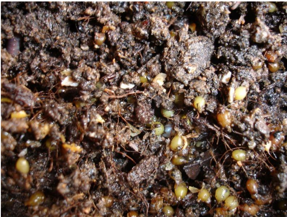
ภาพที่ 2 ไข่ไข่เดือนดิน

ในขณะที่มีการจับคู่แลกเปลี่ยนสเปิร์มกัน ไข่เดือนดินทั้ง 2 ตัวจะไม่ตอบสนองต่อสิ่งเร้าภายนอกอย่างฉับพลัน กรณีเช่นสิ่งเร้าจากการสัมผัสและแสง เมื่อไข่เดือนดินแยกจากกันประมาณ 2-3 วันจะมีการเปลี่ยนแปลงบริเวณโคลเทลลัมเพื่อสร้างถุงไข่ ( Cocoon ) ต่อมาเมือกจะสร้างเมือกคลุมบริเวณโคลเทลลัมและต่อมสร้างโคควิน ( Cocoon secreting gland ) จะสร้างเปลือกของโคควิน ซึ่งเป็นสารคล้ายไคติน สารนี้จะแข็งตัวเมื่อถูกอากาศกลายเป็นแผ่นเหนียวๆ ต่อมาต่อมสร้างไข่ขาว ( Albumin secreting gland ) จะขับสารอัลบูมินออกมาอยู่ในเปลือกของโคควิน Pheretima ซึ่งมีช่องสืบพันธุ์เพศเมียอยู่ที่โคลเทลลัม จะปล่อยไข่เข้าไปอยู่ในโคควิน หลังจากนั้น โคควินจะแยกตัวออกจากผนังตัวของไข่เดือนดินคล้ายกับเป็นปลอกหุ้มๆ เมื่อไข่เดือนดินหดรัดและเคลื่อนถอยหลัง โคควินจะเคลื่อนไปข้างหน้า เมื่อเคลื่อนผ่านช่องเปิดของถุงเก็บสเปิร์ม ก็จะรับสเปิร์มเข้าไปในโคควิน และมีการปฏิสนธิภายในโคควิน เมื่อโคควินหลุดออกจากตัวไข่เดือนดินปลายสองด้านของโคควินก็จะหดตัวปิดสนิท เป็นถุงรูปไข่มีสีเหลืองอ่อนๆ ยาวประมาณ 2-2.4 มิลลิเมตร กว้างประมาณ 1.2-2 มิลลิเมตร ถุงไข่แต่ละถุงจะใช้เวลา 8-10 สัปดาห์จึงฟักออกมา โดยทั่วไปจะมีไข่ 1-3 ฟอง ขึ้นอยู่กับแต่ละสายพันธุ์ ไข่เดือนดินบางชนิดอาจมีไข่มากถึง 60 ฟอง