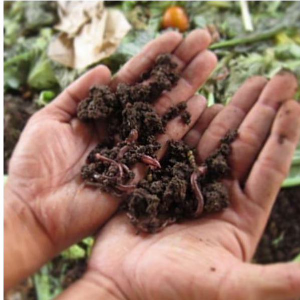
ภาพที่ 9 ลักษณะของ Pheretima peguana

ไส้เดือนดินสายพันธุ์ ฟิเรททิมา พิกัวนา เป็นไส้เดือนดินสีแดงที่มีลำตัวกลมขนาดปานกลาง โดยมีขนาดใกล้เคียงกับไส้เดือนสายพันธุ์ แอฟริกัน ไนท์ครอเลอร์