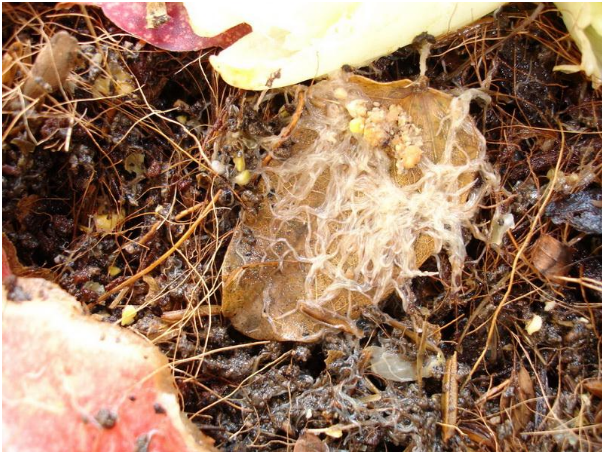
ภาพที่ 3 ตัวอ่อนไส้เดือน

Dendrobaena เป็นต้นซึ่งพบว่ามักจะมีการสืบพันธุ์แบบไม่อาศัยการผสมพันธุ์นอกจากการสืบพันธุ์แบบไม่อาศัยเพศแล้วยังมีการสืบพันธุ์แบบไม่อาศัยเซลล์สืบพันธุ์ด้วยเช่นกระบวนการแบ่งเป็นชิ้นเล็ก และกระบวนการงอกใหม่